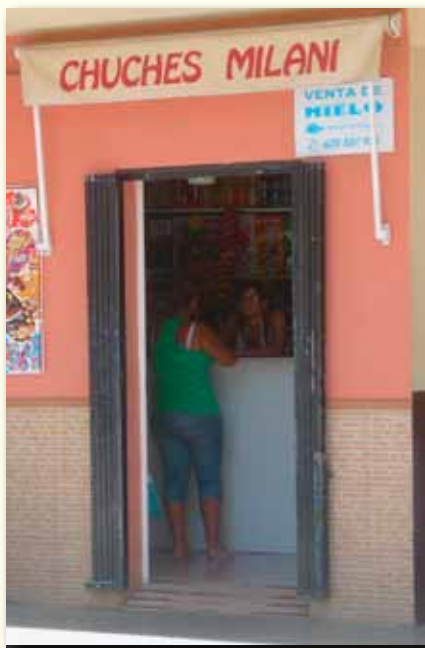
Todo acaba en el mercado.

Lo 1º es preguntarnos por las necesidades básicas de los humanos: individuales, familiares, tribales... ¿Es muy pronto para empezar por la necesidad de ser feliz ? Ni la religión se atreve a negarla, a no ser que esté enferma. Dios hizo al hombre para su bien y felicidad. ¿O no? Que ¿lo hizo mal? Lo discutimos otro día, pero todos queremos ser feliz.